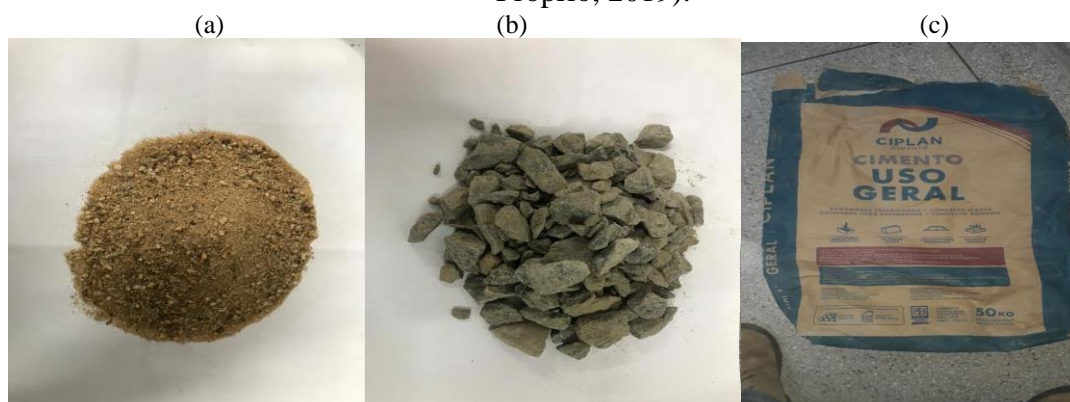
Figura 3- Materiais usados na fabricação do concreto: (a) Areia (b) Brita (c) Cimento..

Os resíduos para substituição do agregado miúdo foram coletados na cidade de Jaraguá, proveniente de uma obra de demolição. O material a ser reciclado passou por procedimentos realizados conforme a NBR 7211 (ABNT, 2005) que regulamenta esse método. O produto triturado pode ser visualizado na Figura 4.