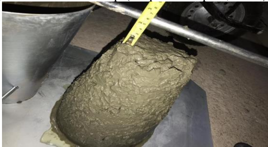
Figura 8- Realização do teste de slump (Arquivo Próprio, 2019).

Após a moldagem os corpos de prova, ficaram por 24 horas no laboratório de solos da Faculdade Evangélica de Jaraguá, para assim serem desmoldados, após esse período foram submetidos ao ensaio de compressão cada qual no seu tempo de cura.