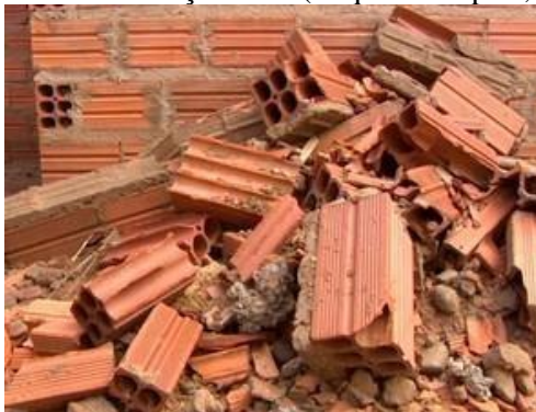
Figura 1- Resíduos da construção civil.

Estes resíduos devem ser depositados em locais específicos, como aterros, pois são altamente nocivos ao meio ambiente, atividade que gera um gasto elevado com descarte. De acordo com Addis (2010) a disposição inadequada dos materiais provenientes da construção civil ocasiona danos irreversíveis ao meio ambiente, como: contaminação dos solos e águas subterrâneas. Por esse fator, surge a necessidade de redução, partindo daí a ideia de reaproveitamento.