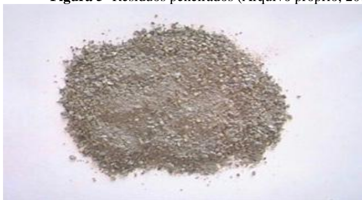
Figura 5- Resíduos peneirados.