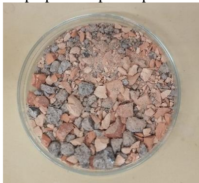
Figura 4- Resíduos já triturados preparados para o peneiramento.