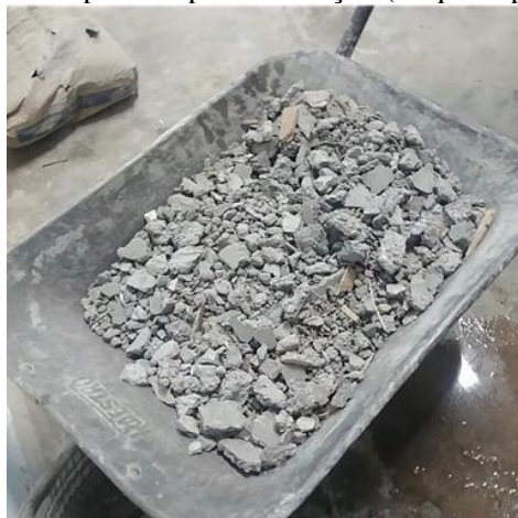
Figura 4- Resíduos separados prontos para trituração.