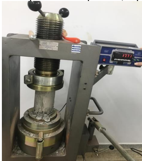
Figura 9 - Corpo de prova na prensa de compressão (Arquivo Próprio, 2019).

Para a realização do ensaio foi usado a prensa de concreto manual digital (Figura 9), onde consiste na execução de pressão nos corpos de prova. Foram devidamente colocados na prensa seguindo os procedimentos determinados pela NBR 5739 (ABNT, 2007), realizou-se a limpeza das faces do corpo de prova e dos pratos da prensa. Na sequência o corpo de prova foi cuidadosamente centralizado no prato inferior. Então iniciou o processo de ruptura, onde o carregamento foi aplicado continuamente e sem choques até a ocorrência da queda da força e ruptura do mesmo. Esse processo foi seguido durante a realização dos ensaios com todos os corpos de prova.