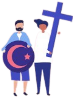
a) Conflito Latente

argumentos para reforçar sua posição e enfraquecer a do outro. Esta emoção estimula as diferenças e dificulta a percepção de um interesse comum. Não é necessário encarar o conflito de forma negativa. É impossível que uma relação entre duas pessoas seja completamente consensual, pois cada um tem suas próprias experiências e circunstâncias. Mesmo que exista afinidade e carinho entre elas, haverá sempre algum desacordo. É importante ter consciência de que o conflito é parte da condição humana e não ignorá-lo ou tratá-lo como algo maligno. Quando entendemos que o conflito é inevitável, podemos encontrar soluções para resolvê-lo sem violência. Por outro lado, se não o encararmos com responsabilidade, ele pode se transformar em confronto e violência.