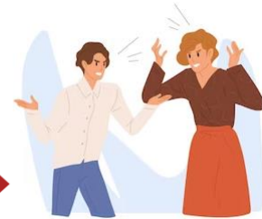
c) Conflito Manifesto

Sentimentos de hostilidade, raiva, descrédito, indiferença, quando é dissimulado, oculto, não manifesto.