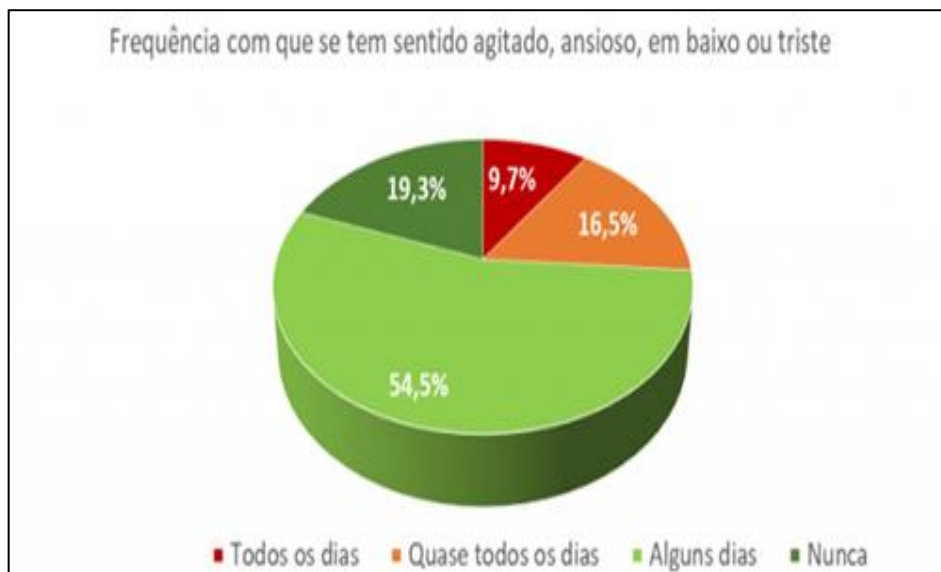
Gráfico 1 - Frequência com que as pessoas têm se sentido agitado, ansioso, pra baixo ou triste:

Devido ao fechamento dos comércios, as pessoas vêm se sentindo vulneráveis, ansiosas, medrosas e não sabem como lidar com todos esses sentimentos e energia que acabam aflingindo o corpo. Uma pesquisa realizada em Portugal por meio de um questionário do ‘Opinião Social’ mostra que com a pandemia os idosos deixaram de ir às ruas comprar bens essenciais; os doentes crônicos faltam consultas e tratamentos; e a população tem medo de ir à hospitais e postos de saúde recorrer a seus serviços com medo de contrair o vírus (GALHARDI, 2020).