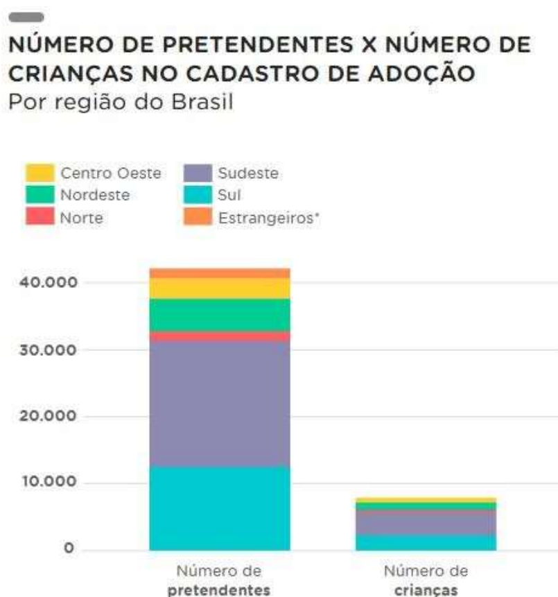
Figura 1 - NEXO JORNAL

Como forma de demonstrar a diferença entre a quantidade de pessoas cadastradas como adotantes e crianças aptas a serem adotadas o NEXO JORNAL, publicou em 11 de agosto de 2017, por meio de uma matéria realizada por Catarina Pignato, Gabriel Zanlorenssi e Vitória Ostetti 1 , gráficos com a exemplificação de que existem 40 (quarenta) mil pessoas dispostas a adotar e 10 (dez) mil crianças disponíveis para adoção: