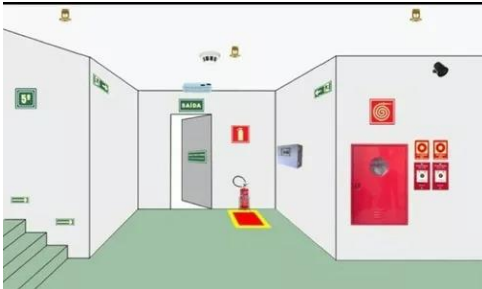
Figura 1: Modelo de sinalizações segundo o Corpo de Bombeiros.